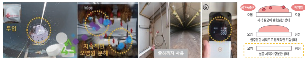
안전하고 청정한 수질 보장