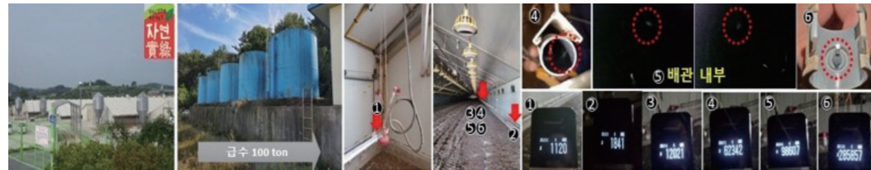
배관 하부라인으로 갈수록 세척 후에는 오염도가 높음